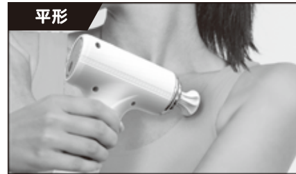
平らな面で均一に刺激