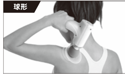
広範囲を効率よく刺激