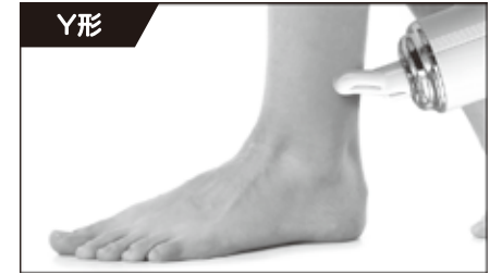
カーブに合わせて刺激