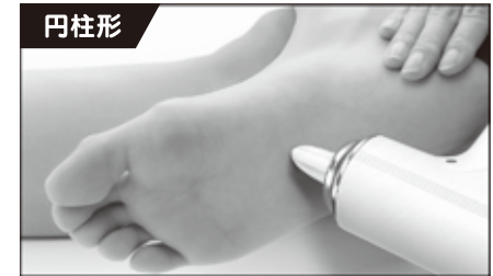
ピンポイントで刺激